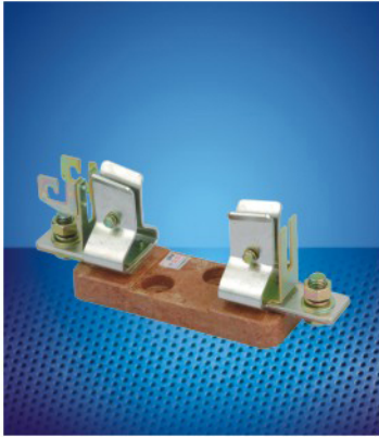
熔断体、熔断器支持件/底座